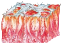
Nasenschleimhautschädigung/ Austrocknung und Entzündung

Es durchfeuchtet nicht nur nachhaltig die Schleimhäute, sondern beugt durch seinen hohen Anteil an antioxidativem Vitamin E neuen Infektionen vor und trägt zur Heilung der gestressten Nasenschleimhäute bei. Verkrustungen lösen sich, die Nasenatmung wird erleichtert, die unangenehmen Symptome einer trockenen Nase gehen spürbar zurück.