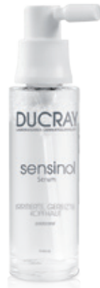
sensinol SOS Serum

Schnelle und dauerhafte Hilfe, milde Waschgrundlage und sanfte Kopfhautpflege. Für die tägliche Anwendung.